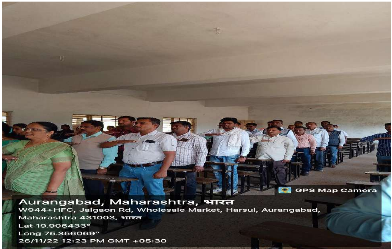
Indian Constitution Preamble pledge by staff and students